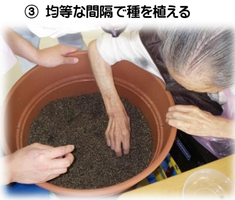
③ 均等な間隔で種を植える