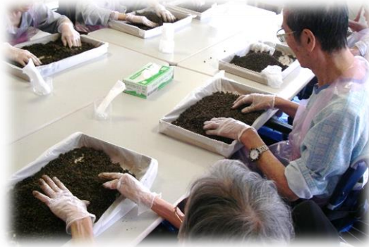
① 土と肥料を混ぜる