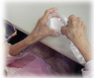
② 湿らせたガーゼの上に種をまく